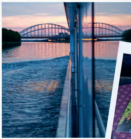
Goldene Stunde auf dem Fluss