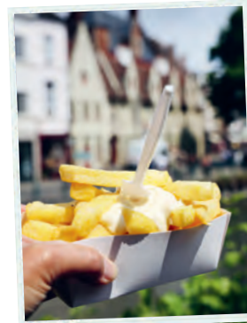
Goldgelbe Fritten sind eines von drei Dingen, die man in Belgien nicht verpassen darf.