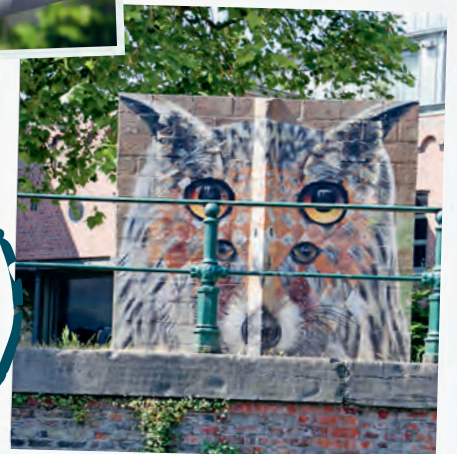
Die Eule wird zum Wolf am Ufer des Lievekanals

Die Städtereise Gent finden Sie im Detail in einer der kommen- den Ausgaben.