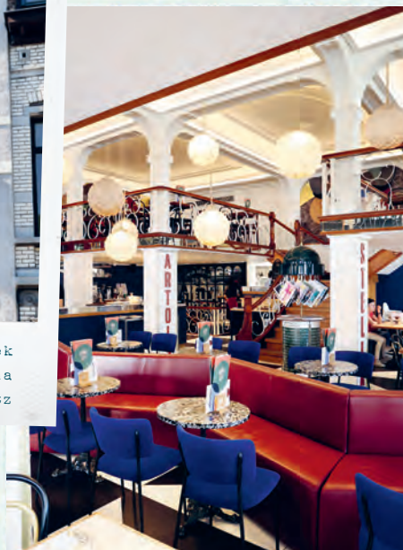
Brüssel bietet Art nouveau, Kunstgalerien & das Le Grand Café bei der Börse.