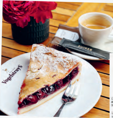
Limburgse Vlaai, der leckere, gedeckte Kuchen ist eine regionale Spezialität.