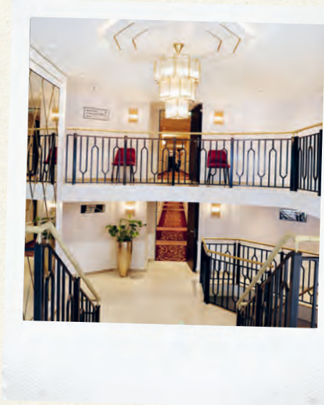
Schicke Empfangshalle zwischen Aida- und Normadendeck.