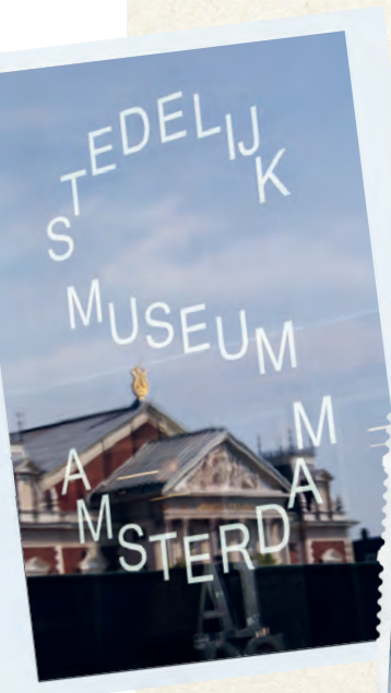
Im Museum oder Open Air, Amsterdam hat Kunst im Überfluss.

Ab hier erobere ich die pulsierende Stadt auf eigene Faust. Amsterdam wird mit über tausend Brücken als Venedig des Nordens bezeichnet. Der Grachtengürtel ist Unesco-Welterbe. Die drei Hauptgrachten sind die Heren-, die Keizers- und die Prinsengracht. Eine Bootsrundfahrt wäre eine tolle Option. Ich entscheide mich für einen Spaziergang. Laufe hinter dem Museumsviertel durch die Pieter Cornelisz Hooftstraat mit den schicken Fassaden der exklusiven Stores. Die Ausgehmeile am Leidseplein erwacht. In den 9 Straatjes gibt es einiges zu entdecken. Die neun Gassen schwappen über von kleinen, individuellen Läden und Cafés. Hier lasse ich mich gerne eine Weile treiben. Aber Vorsicht, die vielen Fahrräder haben es eilig. Mehrmals entgehe ich nur knapp einem Unglück, weil ich fasziniert hinter der Kamera die schönsten Blickwinkel suche. Es gäbe noch so viel zu sehen, doch es heisst Leinen los. Auf zu neuen Ufern.