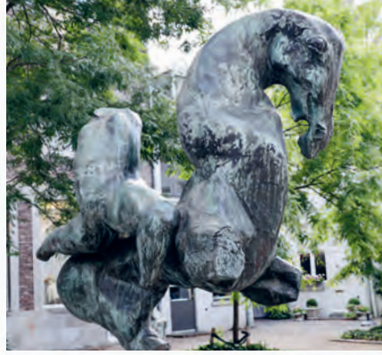
Amazone, Bronze- skulptur von Arthur Spronken.