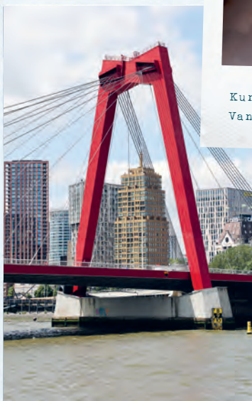
Stadtblick durch die rote Willemsbrücke.

Die Städtereise Rotterdam finden Sie im Detail in einer der kommenden Ausgaben.