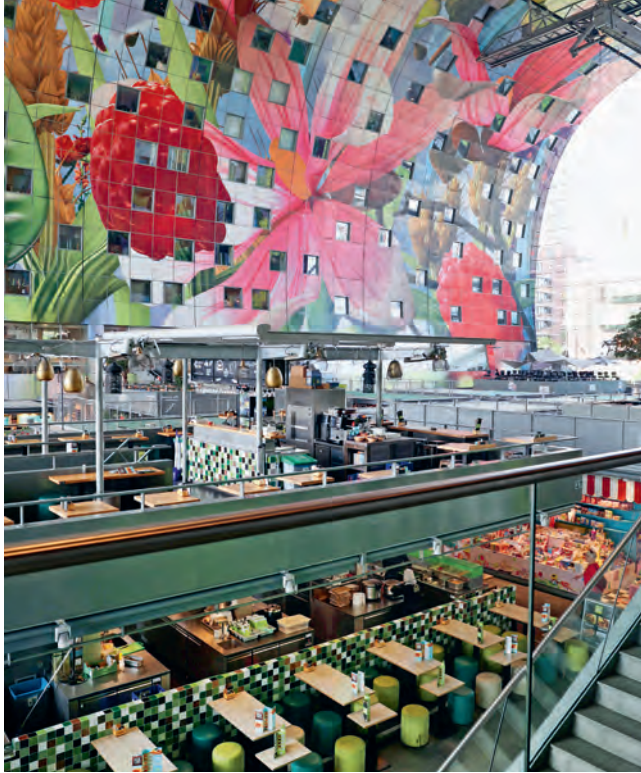
Deckengemälde der Markthalle Rotterdam.

Die Städtereise Rotterdam finden Sie im Detail in einer der kommenden Ausgaben.