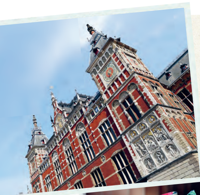
Die Fassade des Bahnhofs Amsterdam Centraal der 1889 eröffnet wurde.