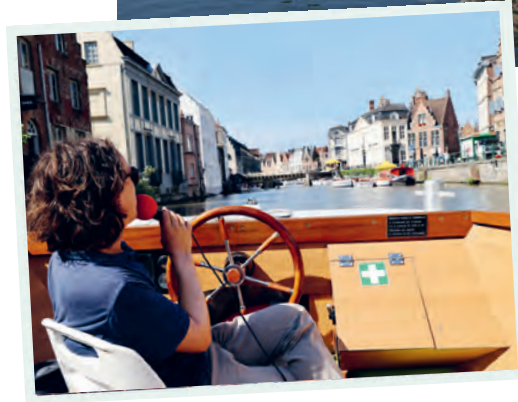
Mit dem Bootje van Gent erhält man gemütlich einen ersten Eindruck.