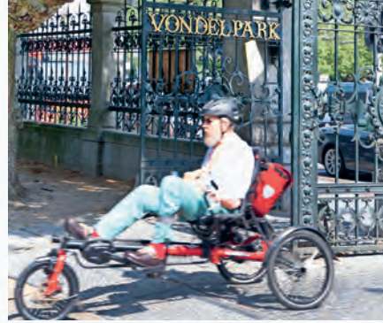
Der grosse Von- delpark beim Museumsquartier ist Erholung pur.