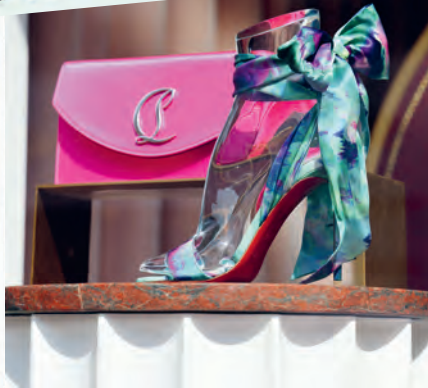
Sommerkreationen von Louboutin an der Pieter Cornelisz Hooftstraat