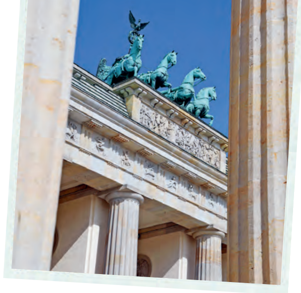
Berlins Wahrzeichen, das Brandenburger Tor mit der Quadrigle.