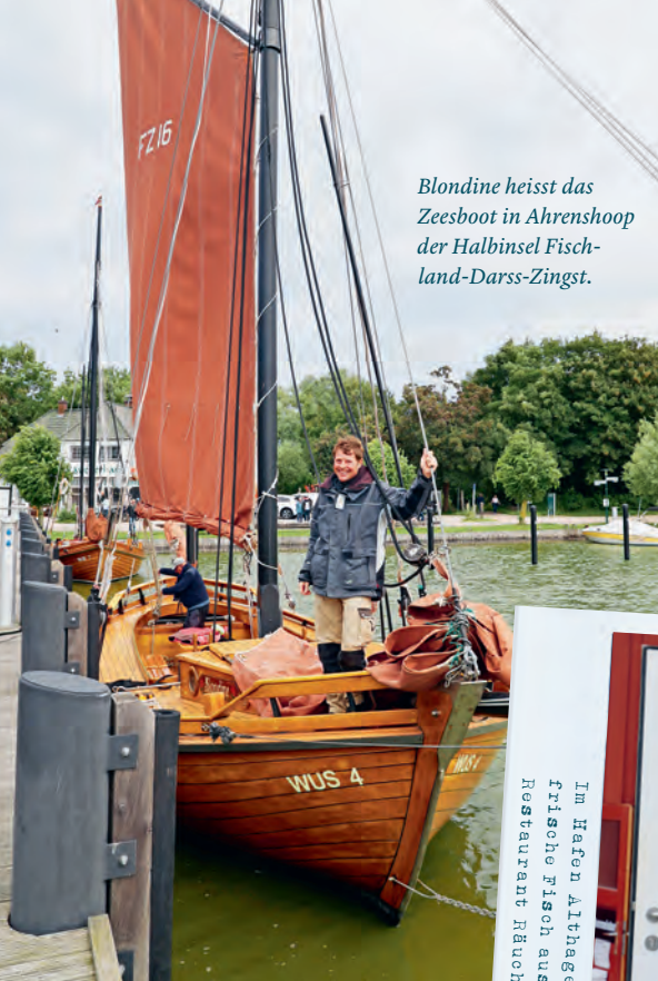
Blondine heisst das Zeesboot in Ahrenshoop der Halbinsel Fischland-Darss-Zingst.