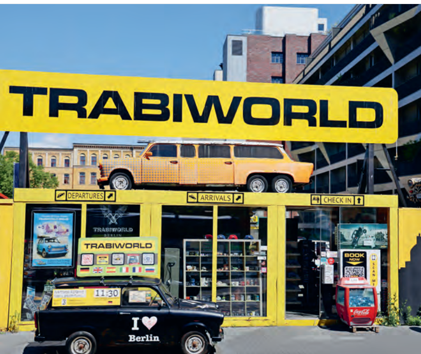
DDR-Nostalgie in der Nähe von Checkpoint Charlie.