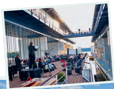
Das Schiffshebewerk Niederfinow wird zur Klangkathedrale.

Nach einer entspannten Anreise mit dem Bus ab Zürich erreichen wir den Hafen in Berlin. An der Greenwichpromenade Tegel erwartet uns die Schiffscrew. Während das Gepäck in die Kabinen gebracht wird, geniessen wir einen Welcomedrink in der Lounge. Unser Abend beginnt stilvoll mit einem köstlichen Dinner und Blick auf den Fluss. Am nächsten Morgen startet die Stadtrundfahrt. Berlin birgt unzählige Sehenswürdigkeiten wie das Brandenburger Tor, den Potsdamer Platz, den Kurfürstendamm und die Kaiser-Wilhelm-Gedächtniskirche. Zuerst geht es aber zum Schloss Charlottenburg, das 1943 stark beschädigt und später originalgetreu wieder aufgebaut wurde. Auch der Bahnhof Zoo, das KaDeWe, die Siegessäule, das Reichstagsgebäude, das Jüdische Mahnmahl und der Checkpoint Charlie stehen auf unserem Programm. Zum Abschluss gibt es Kreuzbergs berühmte Currywurst. In Lehnitz erwartet uns die Excellence Coral zum Mittagessen. Auf dem Sonnendeck wird die Technik für ein aussergewöhnliches Konzert aufgebaut. Am Abend erreichen wir das Schiffshebewerk Niederfinow, ein Wahrzeichen der hohen Ingenieurskunst, wo unser Schiff in einem «Badewannen-Fahrstuhl» 36 Meter auf die neue Flusshöhe gesenkt wird. Ein unvergesslicher Höhepunkt erwartet uns: Das Ensemble Zwischenakt mit Dirigent Johannes Stolte und der Berliner Chor Kantorei Passion berühren mit dem Oratorium «Diluvio» von Michelangelo Falvetti.