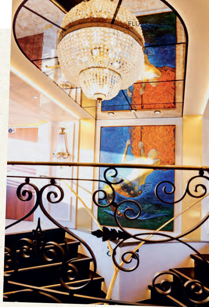
Ein wunderschönes Bild zur Begrüssung. Die Meerjungfrau lässt sich auch beim Schaukeln im Entrée nie aus dem Gleichgewicht bringen.

Der bezaubernde Ostsee-Charme mit Bäderarchitektur und geschichtsträchtige Städte – diese besondere Flussreise auf der eleganten Excellence Coral verspricht unvergessliche Erlebnisse. Von der lebendigen Hauptstadt Berlin führt die Route durch ruhige Flusslandschaften und historische Sehenswürdigkeiten bis hin zu den weissen Kreidefelsen Rügens. Kultur und Natur verschmelzen mit erholsamen und aktiven Ferientagen in einer der schönsten Regionen Deutschlands. Die Reise beginnt mit einer Stadterkundung Berlins und einem Besuch des Schiffshebewerks Niederfinow, einem technischen Meisterwerk. Weiter geht es durch das Untere Odertal, die Hansestadt Stettin und das geschichtsträchtige Peenemünde. Zu den Etappen gehören auch die Insel Rügen, die Ostseebäder Usedom und der Rasende Roland. Bootstouren, malerische Altstädte und musikalische Intermezzi verleihen dieser Flussreise eine besondere Note. Das Schiff selbst ist ein wesentlicher Teil des Erlebnisses: Die Excellence Coral kombiniert stilvolles Design mit einer familiären Atmosphäre. Mit nur 83 Passagieren garantiert sie eine exklusive Reiseerfahrung durch den Norden Deutschlands. Luxuriöse Kabinen mit Panoramafenstern, ein schickes Gourmetrestaurant, eine Panorama-Lounge mit Bar sowie ein grosszügiges Sonnendeck sorgen während der Fahrt für höchsten Komfort. Leinen los!