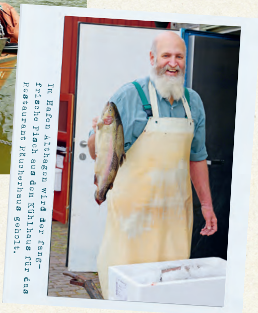
Im Hafen Althagen wird der frische Fisch aus dem Kühlhaus für das Restaurant Räucherhaus geholt.