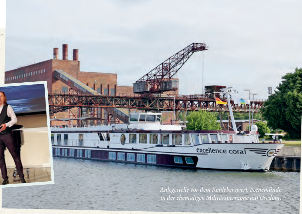
Anlegestelle vor dem Kohlebergwerk Peenemünde in der ehemaligen Militärsperrezone auf Usedom.