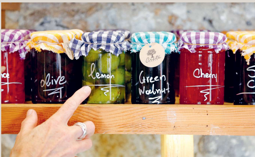
◀ Creta Earth Plakias Lokale Köstlichkeiten wie Olivenöl, Raki, hausgemachte Marmeladen und Kräuter sowie erlesene Handwerkskunst mit allem, was die Insel zu bieten hat. Sie suchen ein einzigartiges Souvenir? Im Creta Earth werden Sie bestimmt fündig. www.cretaeearth.com