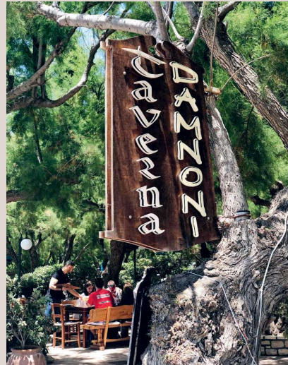
◀ Damnoni Taverna Traditionelle griechische Küche unter grossen Tamarisken am wunderschönen Strand von Damnoni. In dieser gemütlichen Taverne ist der Gast noch König. www.damnoni-taverna.business.site