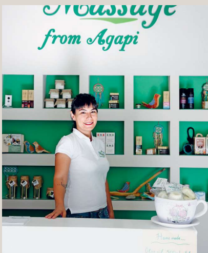
▲ Agapi Olivenöl-Massagen Plakias Lassen Sie sich von den gekonnten Massagen von Agapis Team in einem ihrer beiden Studios verwöhnen. In guten Händen Körper und Seele entspannen und Stress abbauen. www.messagefromagapi.com